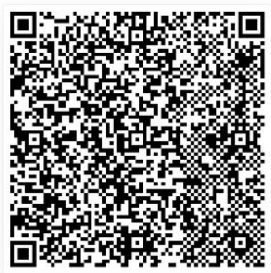
扫描手机二维码工作模式

以下两个二维码用于选择二维码的工作模式，可以根据实际使用环境进行设置，以便达到最佳效果。